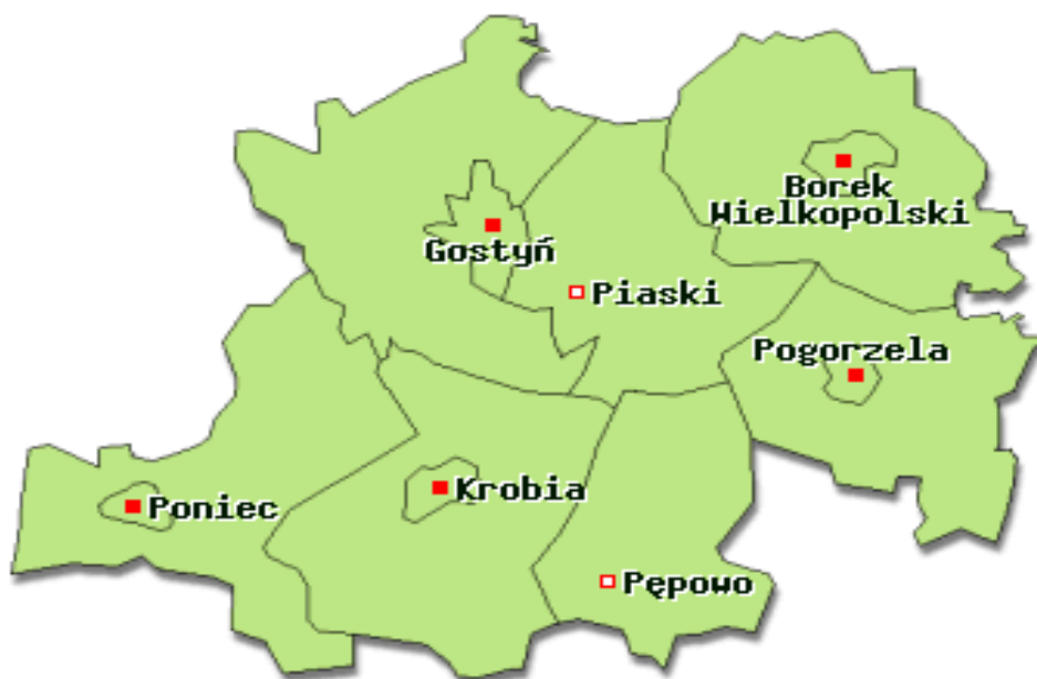
Rys.1. Mapa administracyjna powiatu gostyńskiego

Gmina wiejska Piaski położona jest w południowo - zachodniej części województwa wielkopolskiego, w odległości około 70 km od dużego ośrodka jakim jest Poznań. Wchodzi w skład powiatu gostyńskiego, który poza gminą Piaski obejmuje również, gminy miejsko-wiejskie: Borek Wielkopolski , Krobia , Pogorzela , Poniec , Gostyń oraz gminę wiejską: Pępowo , co zostało zaprezentowane na rys.1.