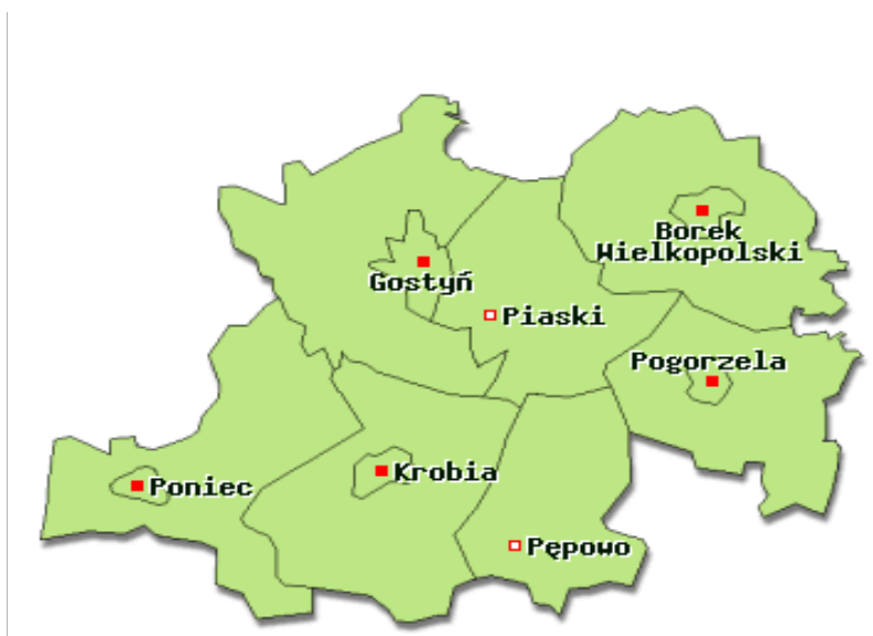
Rys.1. Mapa administracyjna powiatu gostyńskiego

Gmina wiejska Piaski położona jest w południowo - zachodniej części województwa wielkopolskiego, w odległości około 70 km od dużego ośrodka jakim jest Poznań. Wchodzi w skład powiatu gostyńskiego, który poza gminą Piaski obejmuje również, gminy miejsko-wiejskie: Borek Wielkopolski , Krobia , Pogorzela , Poniec , Gostyń oraz gminę wiejską: Pępowo , co zostało zaprezentowane na rys.1.