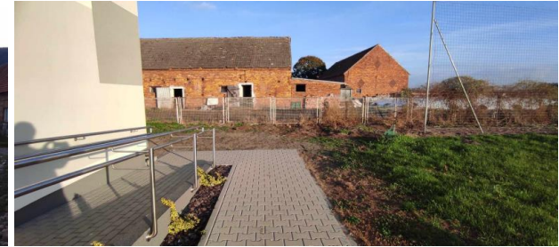
Teren za sala wiejską