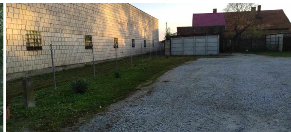
Teren do zagospodarowania za salą wiejską