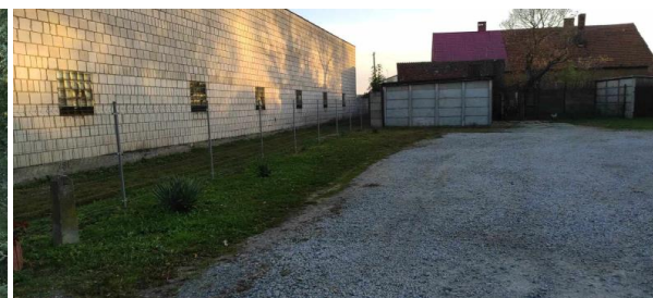
Teren do zagospodarowania za salą wiejską