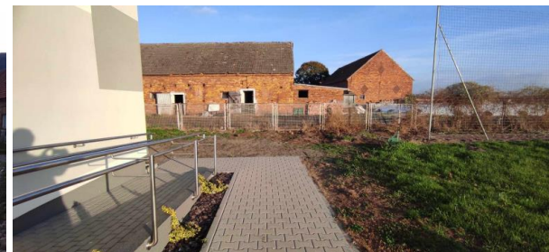
Teren za sala wiejską