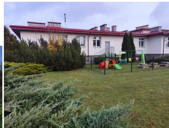
Żłobek i plac zabaw